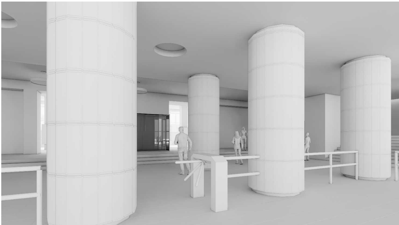
Рис. 4. Тривимірна модель фойє: вид на південь