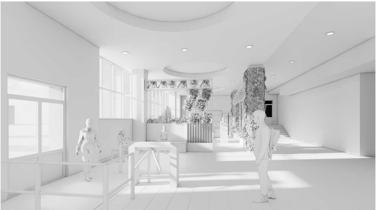
Рис. 7. Пропонований фітодизайн зимового саду. Вид на південний захід