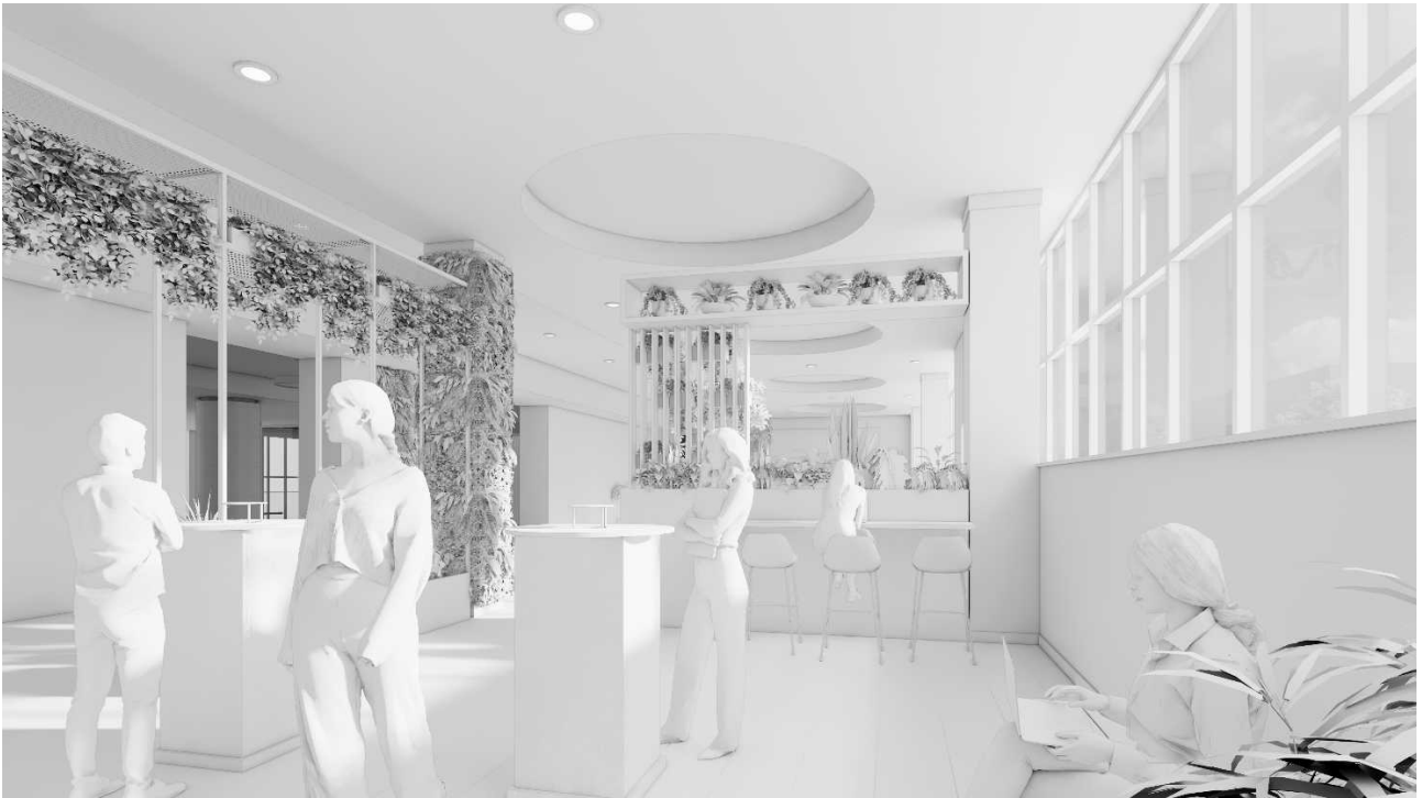
Рис. 8 Пропонований фітодизайн зимового саду. Вид на північний схід