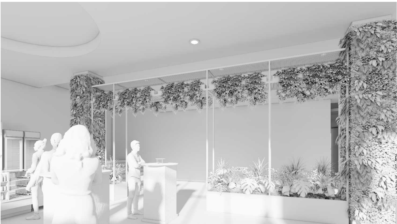
Рис. 9. Пропонований фітодизайн зимового саду. Вид на захід