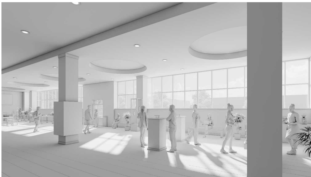
Рис. 1. Тривимірна модель зимового саду. Вид на північний схід

Для пошуку шляхів удосконалення просторової організації створено цифрову модель зимового саду із суміжним приміщенням фойє. (рис. 1-5).