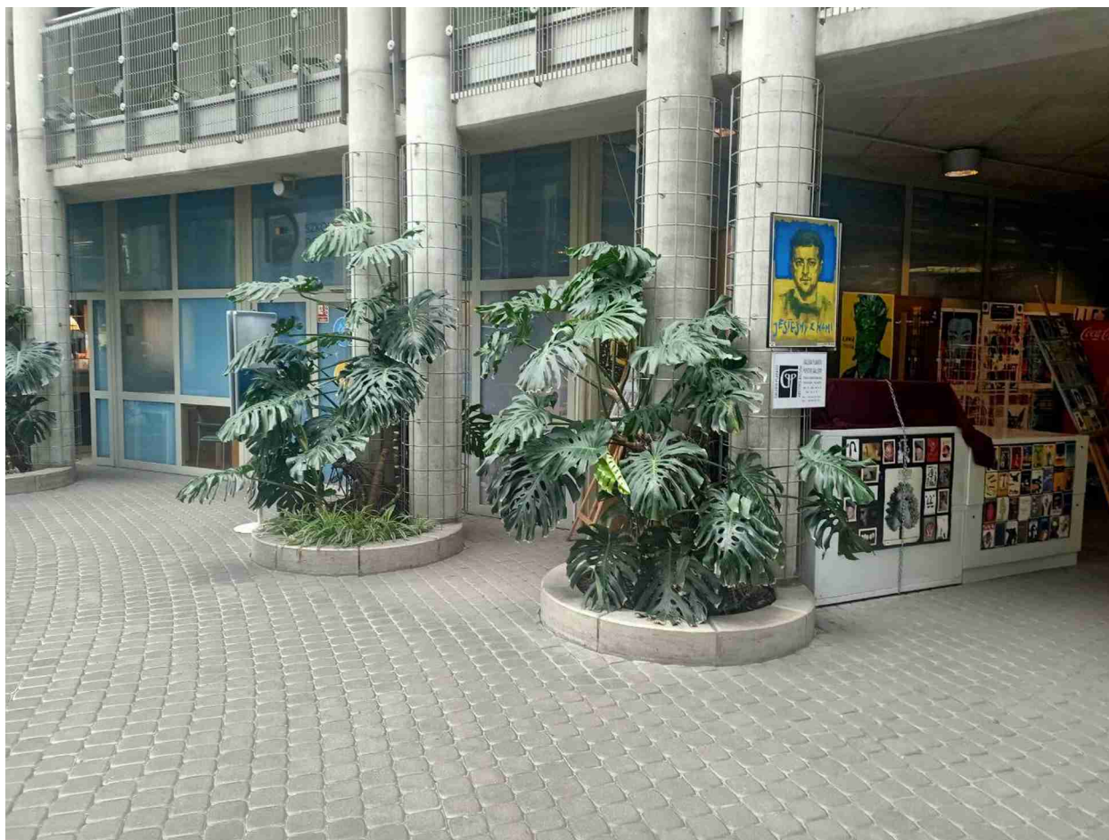
Рис. 11. Приклад озеленення колон з зеленою сіткою – бібліотека Варшавської політехніки

Наведені варіанти відрізняються за складністю, швидкістю досягнення декоративного ефекту та вимогами до подальшого обслуговування, що дозволяє обрати доцільне рішення залежно від архітектурних і експлуатаційних потреб об'єкта. Пропонований асортимент для поверхні колони: Epipremnum aureum , Epipremnum pinnatum , Philodendron scandens .