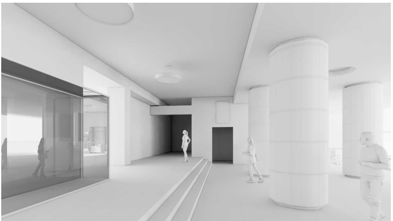
Рис. 3. Тривимірна модель фойє: вид на південний захід