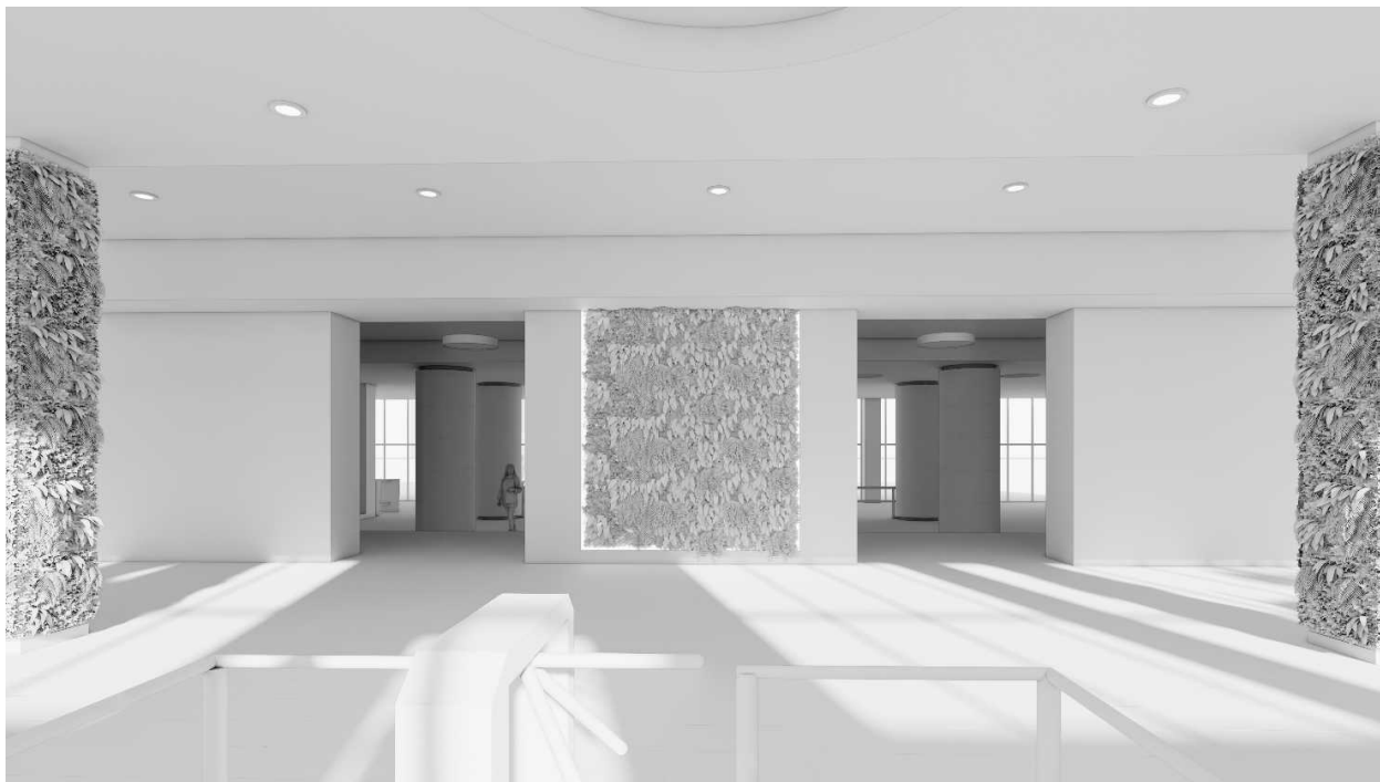
Рис. 10. Пропонований фітодизайн зимового саду. Вид на північний захід

Для забезпечення вкриття колон рослинним шаром запропоновано кілька способів, які дозволяють організувати рослинне покриття колон і підтримують їхній естетичний вигляд протягом усього часу розвитку рослин: