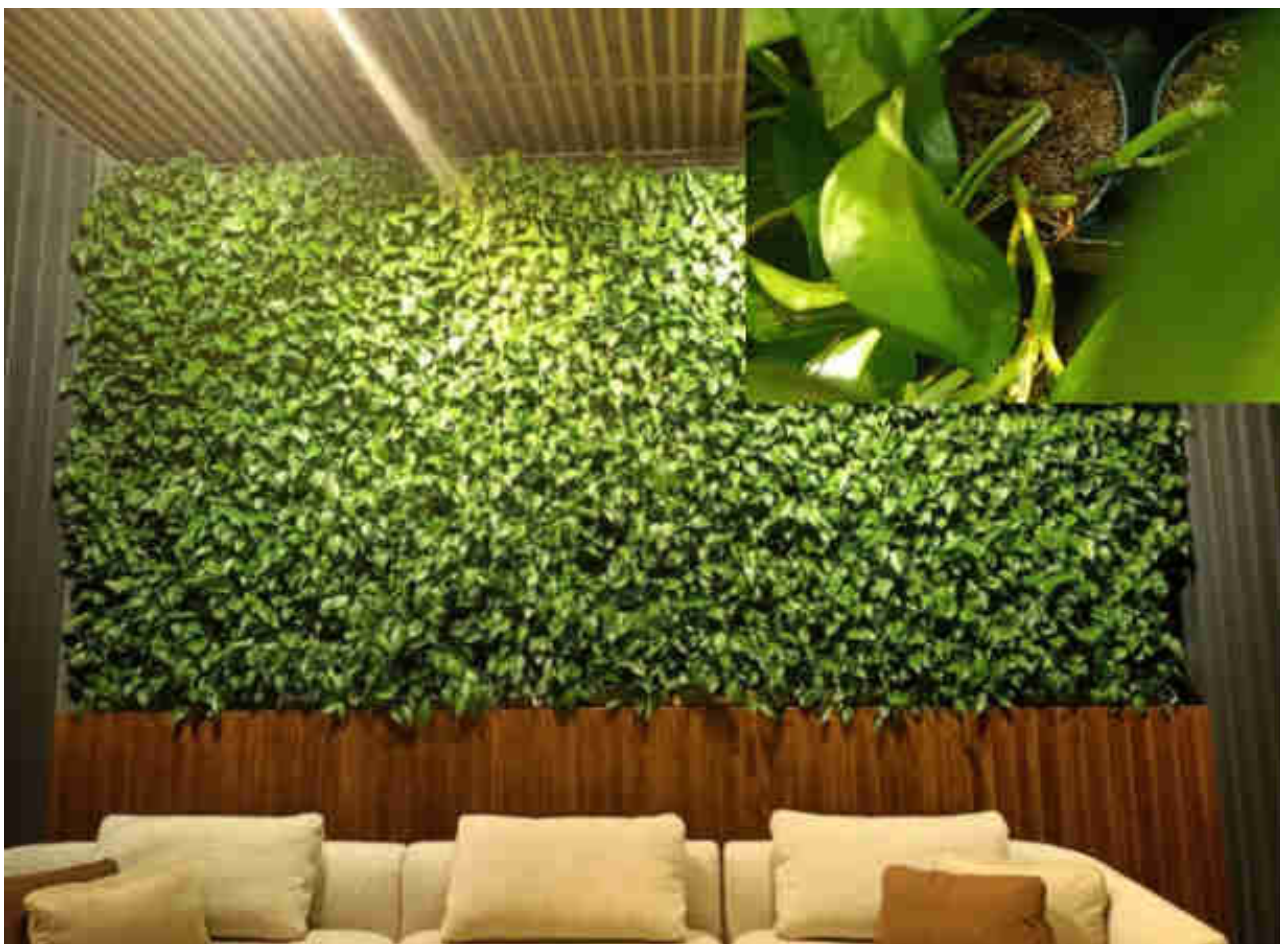
Рис. 12. Приклад озеленення стіни – кав'ярня в м. Києві

Для втілення такого рішення немає необхідності в складних інженерних системах або дорогих спеціалізованих конструкціях. Одним із практичних варіантів є закріплення на стіні модулів із субстратом або контейнерів чи горщиків для рослин, що забезпечує простоту монтування та подальшого обслуговування (приклад наведено на рис. 12). Для облаштування живої стіни доцільно також розглянути використання спеціалізованих кишенькових конструкцій, виготовлених із повсті або пластику, які забезпечують компактне розміщення рослин на вертикальній поверхні.