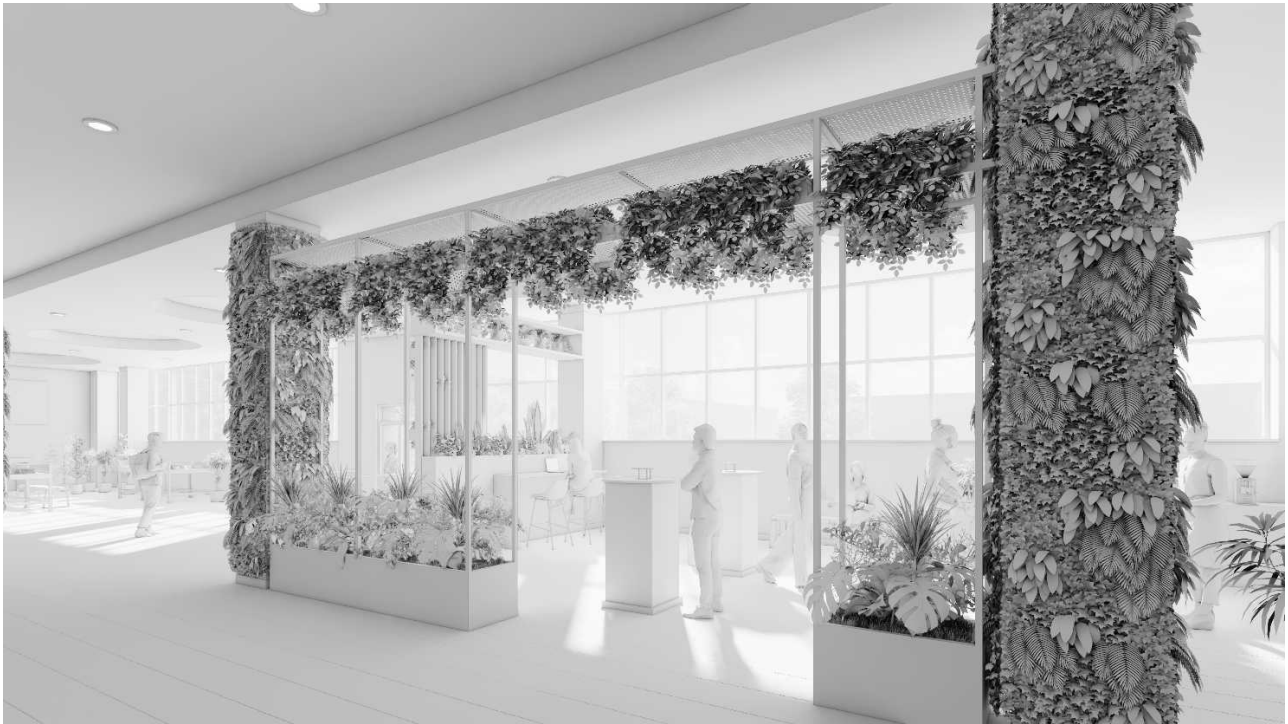
Рис. 6. Пропонований фітодизайн зимового саду. Вид на південний схід