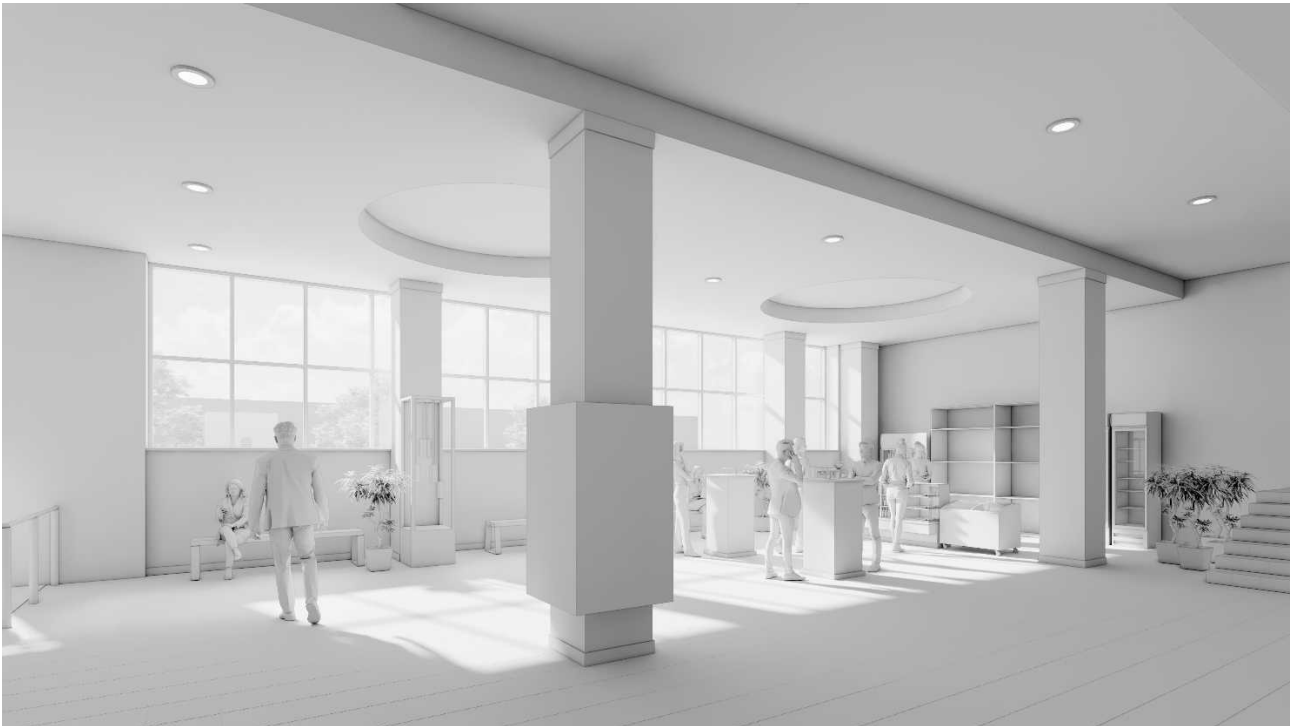
Рис. 2. Тривимірна модель зимового саду: вид на південь